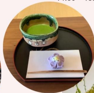
茶会・いけ花体験